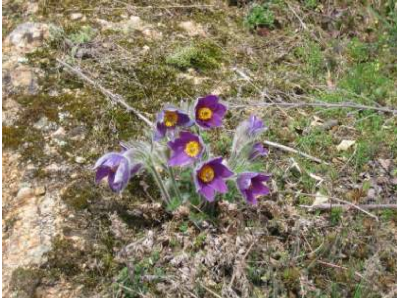
Abb. 2.2 Die Küchenschelle ist an der Bergstraße nur noch in Schriesheim zu bewundern.

Elsässer Sommerwurz, Steppen-Lieschgras und Braunes Mönchskraut - Letzteres kommt in ganz Baden-Württemberg nur noch an der Bergstraße vor. Die hier früher zerstreut vorkommende Küchenschelle (s. Abb. 2.2) ist eine der wenigen auf Mitteleuropa beschränkten Arten (Endemit). Sie besitzt leider nur noch ein einziges Vorkommen in einem Trockenrasen am Branich bei Schriesheim. Die Mager- und Trockenrasen der Bergstraße sind Lebensraum zahlreicher licht- und wärmeliebender