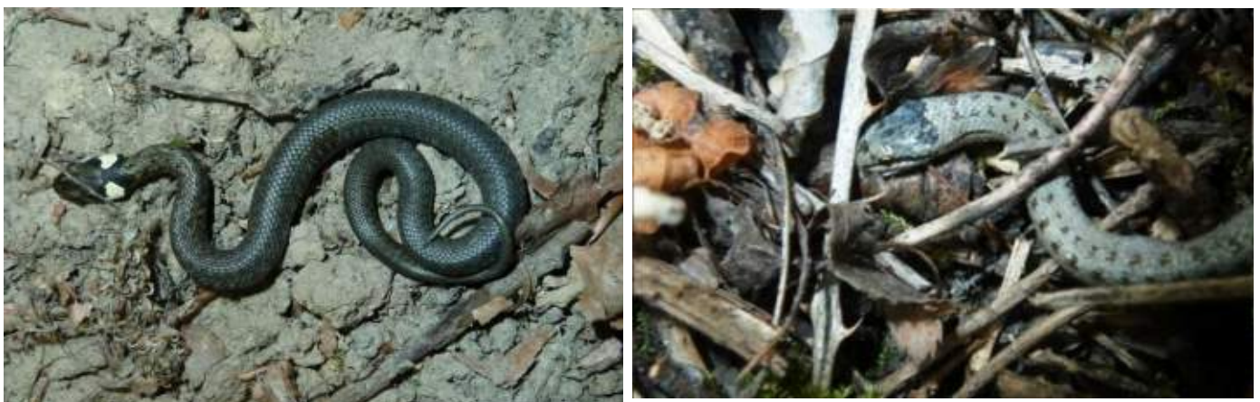
Abb. 7.4: Junge Ringelnatter (links), Junge Schlingnatter (rechts).

Gelegentlich trifft man im Vorgebirge Schlingnattern (s. Abb. 7.4 rechts und [3]) an, deren Zeichnung an die von Kreuzottern erinnern kann. Sie jagen kleine Reptilien, Amphibien und Kleinsäuger wie z.B. Mäuse. Schlingnattern beißen nur, wenn man sie fängt, sind aber wie die