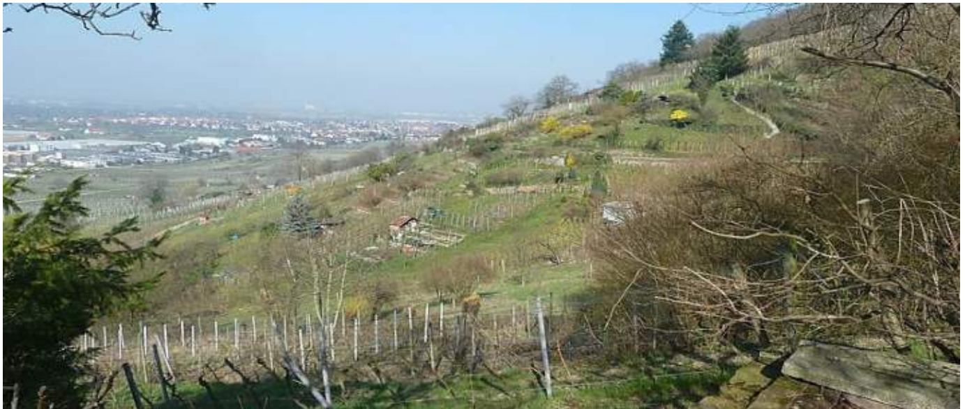
Abb. 4.1: Wingerte in Dossenheim

Der Weinbau ist prägendes Merkmal der Bergstraßenlandschaft (s. Abb. 4.1) und muss es auch bleiben. In den letzten Jahrzehnten sind an der Bergstraße zwei Entwicklungen zu beobachten, die das Erscheinungsbild schleichend verändern: einerseits nutzen weniger Menschen die vorhandenen Grundstücke und andererseits entstehen sehr große, zusammenhängende Weinberge. Beides zusammen führt zu einer Verarmung der vielfältigen Landschaft und Natur an der Bergstraße. Weinbau und Artenvielfalt schließen sich jedoch keinesfalls gegenseitig aus. Der Winzer an der Bergstraße hat es heute in der Hand, den Wingert Schritt für Schritt naturfreundlich zu bewirtschaften und viele gehen diesen Weg auch. Eine eingehendere Beschäftigung mit diesem Thema würde den Rahmen dieses Heftes sprengen. Deshalb veröffentlichen wir parallel zu diesem Heft eine umfangreichere Broschüre zum Thema „Naturfreundlicher Weinbau“, die sich besonders an Winzer richtet. An dieser Stelle sollen deshalb nur einige Überlegungen hierzu vorgestellt werden.