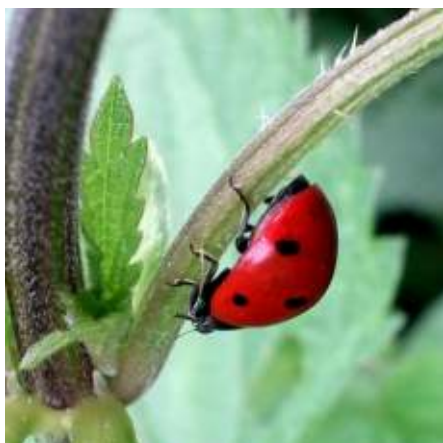
Abb. 5.5: Marienkäfer sind fleißige Blattlaus-Vertilger.

Massenhafte Vermehrung und Ausbreitung von Heuschrecken, Kartoffelkäfern und anderen Insekten sind früher wie auch heute der Alptraum vieler Menschen. Im 19. Jahrhundert verursachte die mit Rebstöcken aus Nordamerika eingeschleppte Reblaus im europäischen Weinbau den Verlust von mehreren Millionen Hektar Rebflächen. Heute ist der Einsatz von Insektenvernichtungsmitteln (Insektiziden) in Landwirtschaft und Privatgärten leider weit verbreitet. Die Folgen sind oft hochproblematisch: Ein Einsatz von Insektiziden beispielsweise gegen Blattläuse tötet auch die blattlausfressenden Insekten.