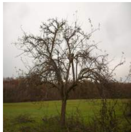
Abb. 3.2: Obstbaum vor und nach einem professionellen Schnitt.