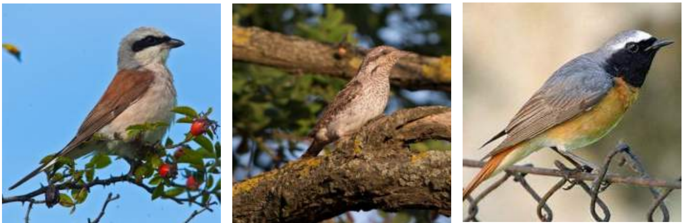
Abb. 6.3: Neuntöter (links), Wendehals (mitte) und Gartenrotschwanz (rechts).

Wer im Herbst das Laub unter die Büsche fegt oder es kompostiert, tut der Natur einen Gefallen. So finden hier zahlreiche Spinnentiere und Insekten einen Lebensraum und dienen später wiederum den Vögeln als Nahrung. Laubhaufen helfen auch dem Igel, der seine Jungen in Laubnestern großzieht, die unter Reisig versteckt sind. Schutz und Nistmöglichkeit finden Gartenvögel wie Rotkehlchen und Zaunkönig auch in Reisig- und Totholzhaufen: gefällttes Stammholz, Reisig, abgeschnittene Äste und entfernte Teile von Sträuchern und Hecken zu Haufen aufgeschichtet. Liegt der Holzschnitt bereits seit einigen Monaten, haben sich mit Sicherheit viele Tiere wie Käferlarven, Wildbienen oder Vögel in ihm eingefunden. Die Tiere nutzen den Schutz durch die Verflechtungen innerhalb des Haufens, um ihren Nachwuchs darin großzuziehen und Schutz vor Fressfeinden wie Katzen, Mardern und Elstern zu finden. Insbesondere ältere Sträucher und Heckengehölze sollen nicht in der Zeit vom 1. März bis zum 30. September geschnitten werden, um die gut versteckten Nester der brütenden Vögel nicht für Nesträuber offenzulegen. Es ist sinnvoll Hecken ca. alle 5 bis 10 Jahre bereichsweise auf Stock zu setzen (das heißt 15 – 40 cm über dem Boden abzuschneiden). Das verjüngt sie und beugt einer Verkahlung vor. Beeren- und samentragende Pflanzen sowie nicht abgeschnittene Stauden sind im Winter wichtige Futterquellen für Vögel (s. Abb. 6.5). Wer diese erst im Frühjahr entfernt, kann viele