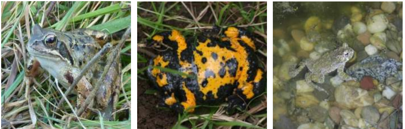
Abb. 7.2: Grasfrosch (links), Gelbbauchunke in Schreckstellung (mitte) und Wechselkröte im Laichgewässer (rechts)

Sehr selten finden sich in der Umgebung der Schriesheimer und Dossenheimer Steinbrüche Wechselkröten (s. Abb. 7.2. rechts). Auch sie laichen in den dortigen Kleingewässern.