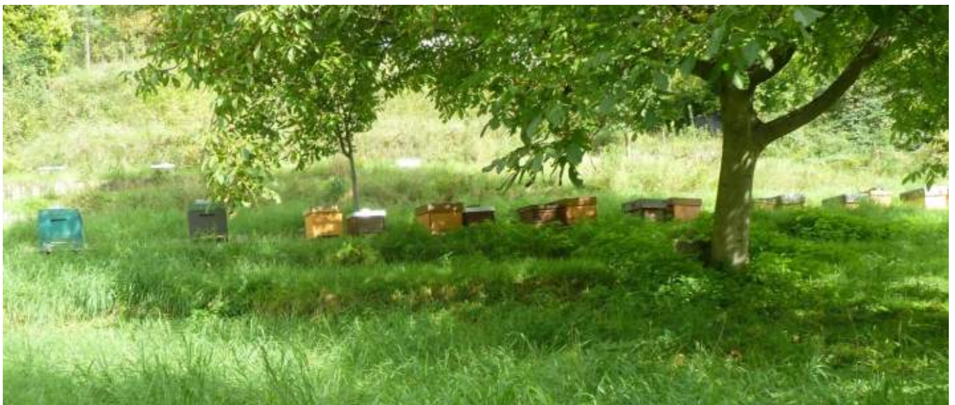
Abb. 5.1: Honigbienenvölker am Blütenweg bei Sulzbach

Nur wenige Insekten haben es geschafft, bei uns Menschen zu Sympathieträgern zu werden: Marienkäfer, Bienen und Schmetterlinge. Zumeist werden sie jedoch eher mit negativen Erfahrungen in Zusammenhang gebracht oder sind gar als „Ungeziefer“ verhasst: Stechmücken, Blattläuse, Mehlmoten, Fruchtfliegen, Rebläuse. Andererseits haben Insekten eine zentrale Bedeutung für das Funktionieren praktisch aller Ökosysteme auf der Erde (außer den Meeren). Insekten, deren größte Gruppe die Käfer stellen, gehören zu dem sogenannten Arthropoden. Diese werden auch Gliederfüßer genannt und stellen den bei weitem erfolgreichsten Tierstamm. Zu ihnen zählen außerdem, Spinnentiere, Krebstiere und Tausendfüßler. Gliederfüßer sorgen durch den Verzehr von Pflanzenresten und Tierleichen für die Erneuerung von Böden und den Erhalt des Nährstoffkreislaufs. Ein Großteil wird wiederum selbst zur Beute von räuberischen Insekten, Spinnen, Vögeln oder Kleinsäugetern. Insekten sind aus Sicht des Menschen sowohl Nützlinge (z.B. Bienen und Marienkäfer) als auch Schädlinge (z.B. Borkenkäfer, Reblaus und Kartoffelkäfer). Sie haben eine zentrale ökonomische Bedeutung für den Menschen: Sie helfen bei der Pflanzenvermehrung, sorgen für reiche Obsternten, können aber auch krank machen und Ernten vernichten.