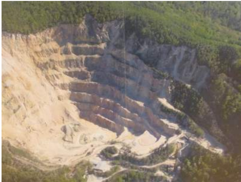
Abb. 2.3 Der Wachenberg-Steinbruch in Weinheim.

Steinbrüche sind einerseits erhebliche Eingriffe in die Landschaft, andererseits bieten sie Lebensräume für etliche Tier- und Pflanzenarten, die außerhalb kaum noch überleben können. In