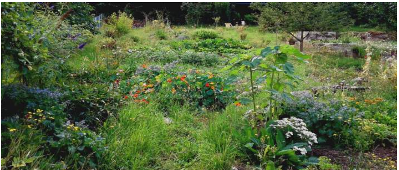
Abb. 3.3: Großer Garten mit Gemüse und Blumen am Zeilberg in Hemsbach

Wasser ist in den meisten Gärten im Vorgebirge Mangelware. Nur an wenigen Stellen bieten Bachläufe die Möglichkeit Kanister mit Wasser zu füllen und auf das Grundstück zu bringen. Das Anzapfen von Gewässern durch installierte Leitungen ist gesetzlich verboten. Die meisten Quellen und Bäche trocknen im Sommer zudem aus. Es bietet sich daher an, Regenwasser von bestehenden Geräteschuppendächern in Tonnen aufzufangen (pro m 2 Dachfläche sind über 500 Liter im Jahr zu erwarten). Eine Mulch-Schicht aus Pflanzenresten, Schnittgut, Blättern usw. um die Gemüse- und Obstpflanzen herum bzw. auf den Baumscheiben verteilt, hilft den Boden feucht zu halten. Generell sollte man jedoch am Bergstraßenhang auf Pflanzen mit hohem Wasserbedarf verzichten.