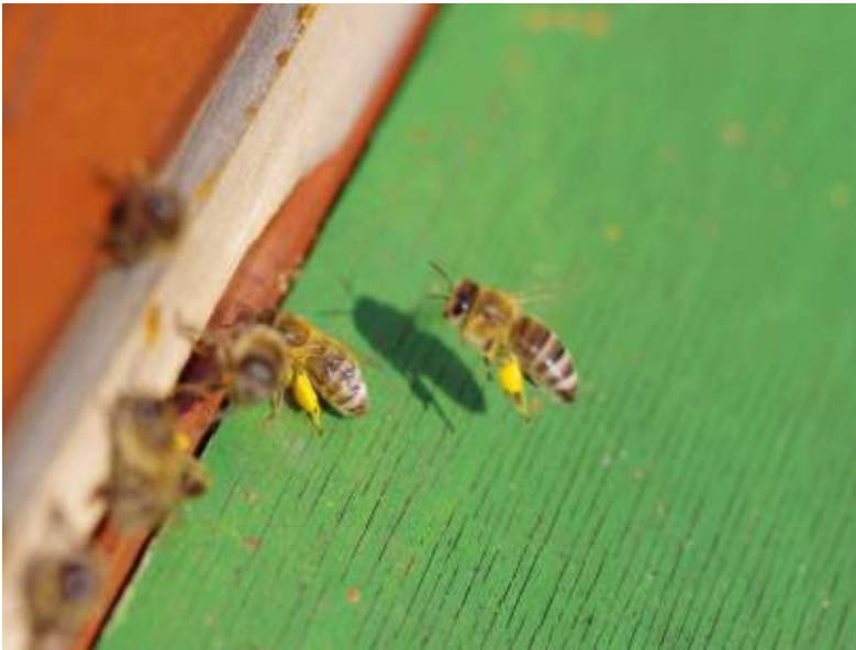
Abb. 5.4: Honigbienen beim Polleneintrag.

In privaten Gärten erfolgt ein Großteil der Bestäubungsleistung durch Wildbienen (s. z.B. Abb. 5.2 mitte), zu welchen auch die Hummeln zählen. Unersetzbar ist jedoch auch die Bestäubung durch Schmetterlinge, Schwebfliegen, Käfer, Wespen und andere Insekten (s. Abb. 5.2, 5.3 und 5.6). Am Boden lebende Insekten wie die Ameisen ernähren sich von den Samen und Früchten kleinerer Pflanzen. Auf dem Transport verloren gegangene Samen keimen an anderer Stelle wieder aus und werden so nach und nach über größere Distanzen verbreitet.