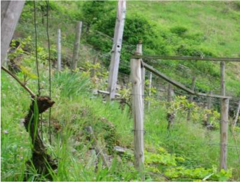
Abb. 4.2: Begrünter Wingert in Dossenheim