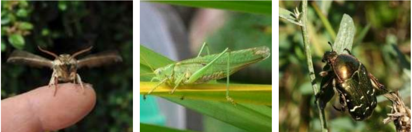
Abb. 5.6: Nachtfalter (links), Heupferd (mitte) und Rosenkäfer (rechts).