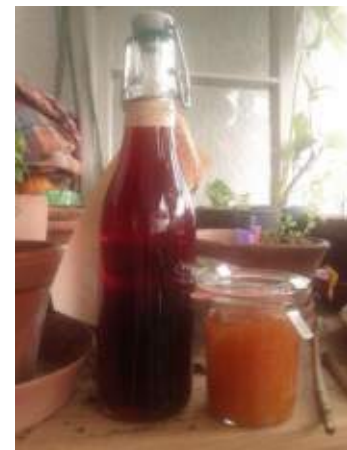
Abb. 3.4: Durch Verarbeiten zu leckeren Produkten, kann die Genussdauer der Ernte verlängert werden.