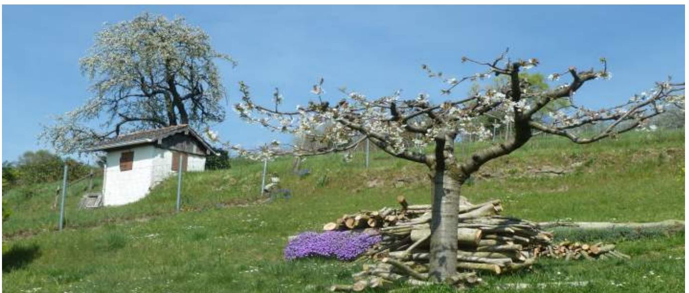
Abb. 8.1: Eine Weinberghütte an der Badischen Bergstraße