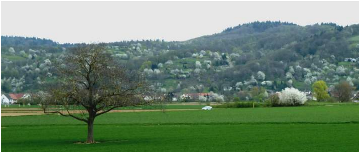
Abb. 2.1: Die blühende Badische Bergstraße bei Sulzbach

Im Unterschied zur frühen Besiedlungsphase ist die Bergstraße heute dicht besiedelt. Ein gutes Drittel des Naturraums ist geprägt von Siedlungs- und Verkehrsflächen. Eine Folge der naturnahen Lage und der Nähe zu den Großstädten Heidelberg und Mannheim.