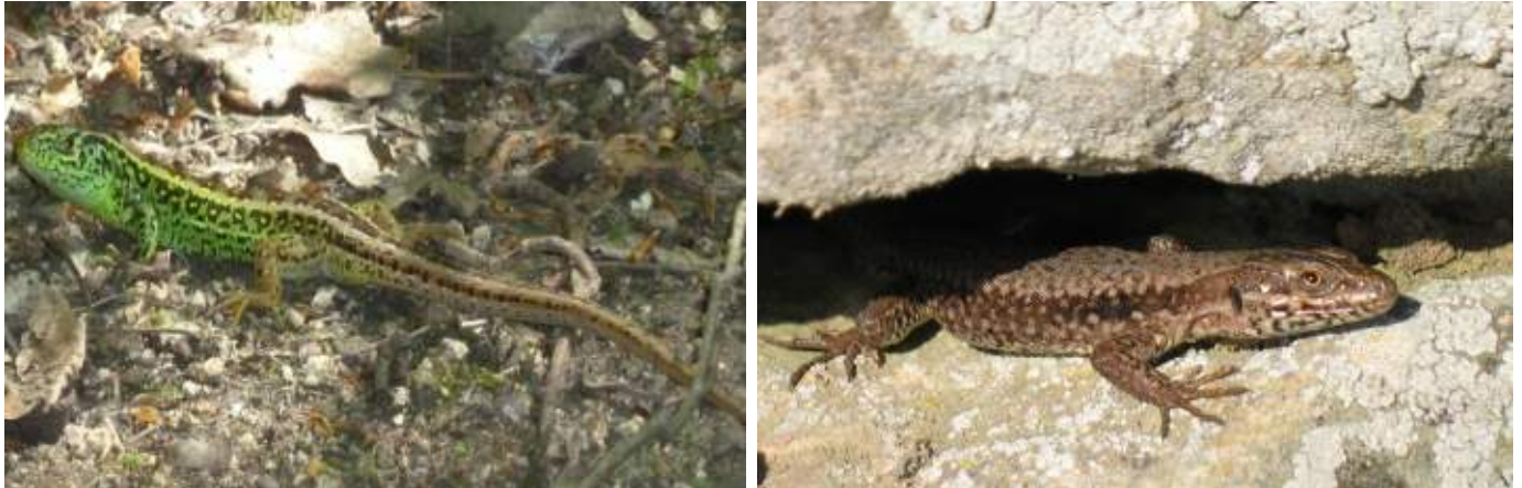
Abb. 7.3: Männliche Zauneidechse im Hochzeitskleid (links) und Mauereidechse (rechts).

ermöglicht. Die häufigsten Reptilien im Vorgebirge sind Zauneidechsen (s. Abb. 7.3 links), obwohl ihre Anzahl deutlich zurück gegangen ist. Sie leben an Stein- oder Totholzhaufen, Trockenmauern, Lössböschungen und auf Magerrasen unweit von Gebüsch und Hecken. Ihre Ernährung besteht vor allem aus Insekten. Die Zauneidechse verkriecht sich vorzugsweise in Erdverstecken, auch Mauselöchern, und legt ihre Eier gerne in sandige Erde. An den Mauern alter Burganlagen und hohen, sonnenbeschienenen Mauern (s. Abb. 7.5) werden sie durch die sehr flinken Mauereidechsen (s. Abb. 7.3 rechts) ersetzt. Diese legen ihre Eier sehr gerne im Hintergemäuer von Trockenmauern ab und überwintern auch dort. Natürliches Vorbild sind dabei vermutlich Felsspalten.