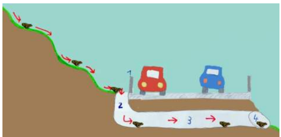
Abb. 7.1: Erdkrötenpärchen auf der Laichwanderung (links), Prinzip der Amphibienleitanlage an der B3 nördlich von Hemsbach (rechts).

Gartentümpeln oder sogar in mit Wasser gefüllten Reifenspuren. Auch die bei uns vorkommenden Molcharten wandern im Frühjahr zu ihren Laichgewässern. Berg-, Teich- und Fadenmolche sind allesamt im Frühjahr unterwegs. Sie legen ihre Eier an Wasserpflanzen in stehenden Gewässern ab, da sich die Larven nur dort entwickeln können. Kammolche bevorzugen Lebensräume und Laichgründe in der Ebene. Die europaweit geschützten Gelbbauchunken (s. Abb. 7.2 mitte und [1]) kommen in der Region vor allem in den Steinbrüchen der Bergstraße vor (z.B. in Weinheim,