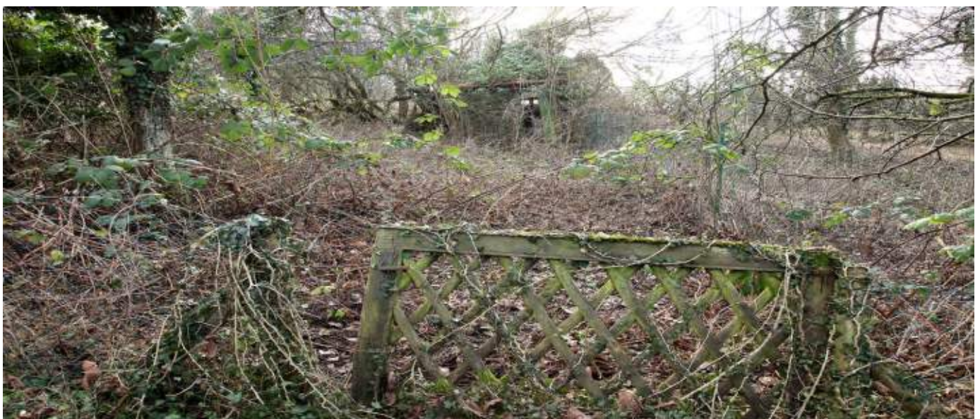
Abb. 2.5: Brache, vorrückender Wald bei Weinheim-Nächstenbach