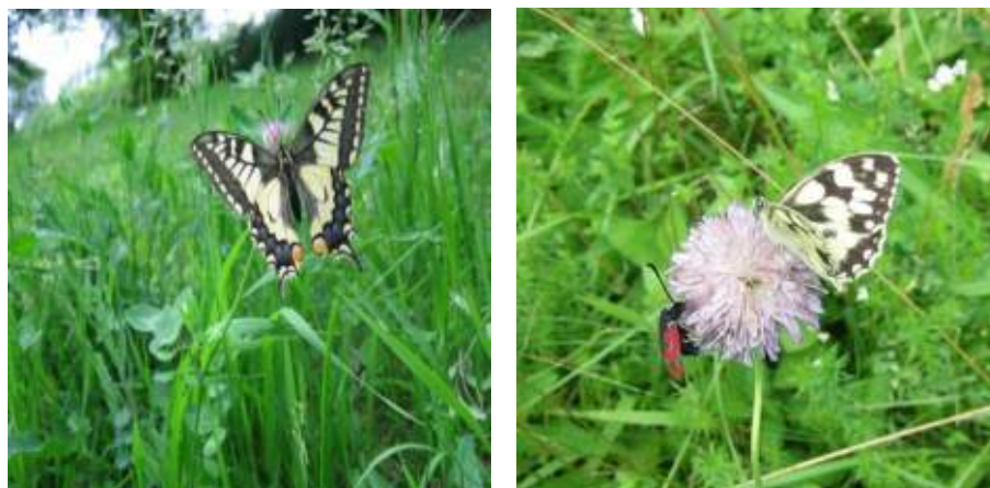
Abb. 5.3: Schwalbenschwanz (links), Widderchen und Schachbrettfalter (rechts)

Arbeiterinnen eines Honigbienenvolks (s. Abb. 5.1 und 5.4) können 2 - 3 Mio. Blüten pro Tag besuchen. Der volkswirtschaftliche Nutzen der Bestäubungsleistung allein der Honigbienen für unsere Nutzpflanzen übersteigt den Wert ihrer beachtlichen Honigproduktion um das 10- bis 15-fache. Dies sind rund 2 Milliarden Euro jährlich in Deutschland. Damit nimmt die Honigbiene (s. Abb.