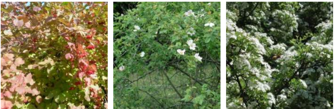
Abb. 6.2: Geeignete Sträucher für das Bergstraßen Grundstück: Gemeiner Schneeball (links), Heckenrose (mitte) und Weißdorn (rechts)

Sträucher, Gebüsche und Hecken sind wichtige Lebensräume für Vögel und andere Tiere. Hier können Vögel brüten, Nahrung suchen und Deckung finden. In der Regel sind an der Bergstraße Hecken und Gebüsche in ausreichender Zahl vorhanden. Sollte dies vor Ort einmal nicht der Fall sein und man möchte welche anlegen, sollte man am besten fruchttragende, einheimische Gehölze pflanzen (s. Abb. 6.2 und Tab. B im Anhang der Broschüre). Die Früchte bilden im Winter eine wichtige Nahrungsquelle für viele Tiere. So ist z.B. das für Menschen giftige „Pfaffenhütchen“ Winternahrung