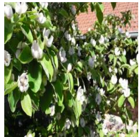
Abb. 3.1: An der Bergstraße zu finden: Himbeeren (links), Zwetschgen (mitte) und Quittenblüten (rechts).