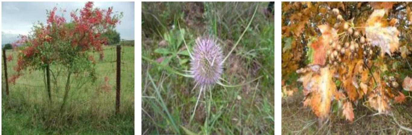
Abb. 6.5.: Beliebte Futterpflanzen für Vögel: Früchte des Pfaffenhütchen (links), Wilde Karde (mitte) und Früchte der Elsbeere (rechts).

Auch für Fledermäuse gibt es Kästen, die speziell auf die Bedürfnisse dieser Tiere abgestimmt sind. Fledermauskästen sind meist flacher gebaut und zum bequemen Einfliegen unten offen (s. Abb. 6.4 rechts). Sie sollten in mindestens 4 m Höhe angebracht werden, vor Wind geschützt sein und wenn möglich nach Osten bis Süden weisen (s. [8]). Oft dauert es eine ganze Weile bis solche Kästen bezogen werden, Sie sollten sich also nicht entmutigen lassen, wenn es nicht gleich klappt.