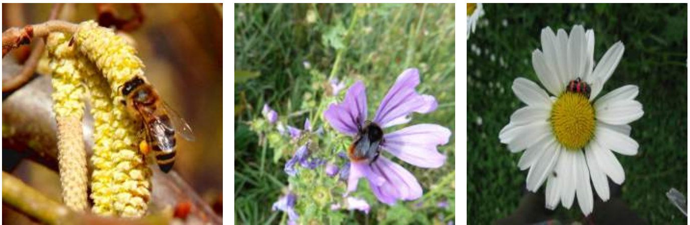
Abb. 5.2: Honigbiene an Haselblüten (links), Hummel auf Malvenblüte (mitte), Käfer auf Margerite (rechts).

80% aller Wild- und Kulturpflanzen sind auf Insektenbestäubung angewiesen. Zwar können sich viele Pflanzen auch durch die Bildung von Ausläufern vermehren (hier entstehen sog. "Klone"). Insekten sind aber die zentrale Säule für die pflanzliche Vermehrung und Fruchtbildung. Ohne sie können die meisten Pflanzenarten keine oder nur sehr viel weniger Früchte und Samen ausbilden und ihre Art somit kaum erhalten. Angelockt werden Insekten gewöhnlich durch große und lebhaft gefärbte, häufig spiegelsymmetrisch gestaltete Blütenhüllen. Sind Nektar und Duftstoffe vorhanden, spricht man von Nektarblumen, fehlen diese, wird die Pflanze als Pollenblume bezeichnet. Hinsichtlich der Hauptbestäuber haben Pflanzen bestimmte Anpassungsmerkmale entwickelt. So befindet sich der Nektar bei von Schmetterlingen bestäubten Pflanzen oft am Grund langer Röhren. Bei Pflanzen, die überwiegend von Fliegen bestäubt werden, dominieren hingegen flache Blüten. Typisch ist hier ein charakteristischer Pilz- oder Aasgeruch. Sind Nachtfalter die Hauptbestäuber, öffnen sich die Blüten häufig erst am Abend. Die Blüten sind dann meist hellgelb oder weiß gefärbt so dass sie im Abendlicht oder im Mondschein hell erscheinen. Sie besitzen oft eine intensive Duftnote.