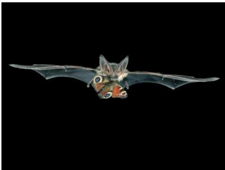
Abb. 6.1: Graues Langohr auf nächtlicher Jagd

Viele Vogel- und Fledermausarten sind auf bestimmte Insektenarten spezialisiert, die vorzugsweise auf oder von einheimischen Wildpflanzen leben. Diese Insekten können nur dann dauerhaft an einem