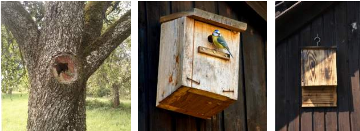
Abb. 6.4: Natürliche Baumhöhlen (links) bieten Raum für verschiedenste Tiere; Nisthilfen für Vögel, hier eine Vollhöhle (mitte) werden meist gerne genutzt, z.B. von der Blaumeise. Eine Quartierhilfe für Fledermäuse (rechts).

klein, wird sie von kleineren Vögeln wie Meisen, Kleibern, Baumläufern aber auch vom Wendehals (s. Abb. 6.3 mitte) genutzt, beispielsweise als Kinderstube. Fault sie aus und wird das Einflugloch größer (s. Abb. 6.4 links), so können auch größere Arten wie Tauben, Käuze oder Dohlen einziehen. Außer dem Durchmesser spielen auch die Form der Öffnung, die Größe der Höhle, ihre Ausrichtung und der Abstand zum Boden eine Rolle. Auch Fledermäuse nutzen solche Höhlen, zumeist als Sommerquartier. Baumhöhlen sind daher sehr wertvoll. Egal ob der Baum mit der Höhle gesund, krank oder tot ist, er sollte erhalten werden.