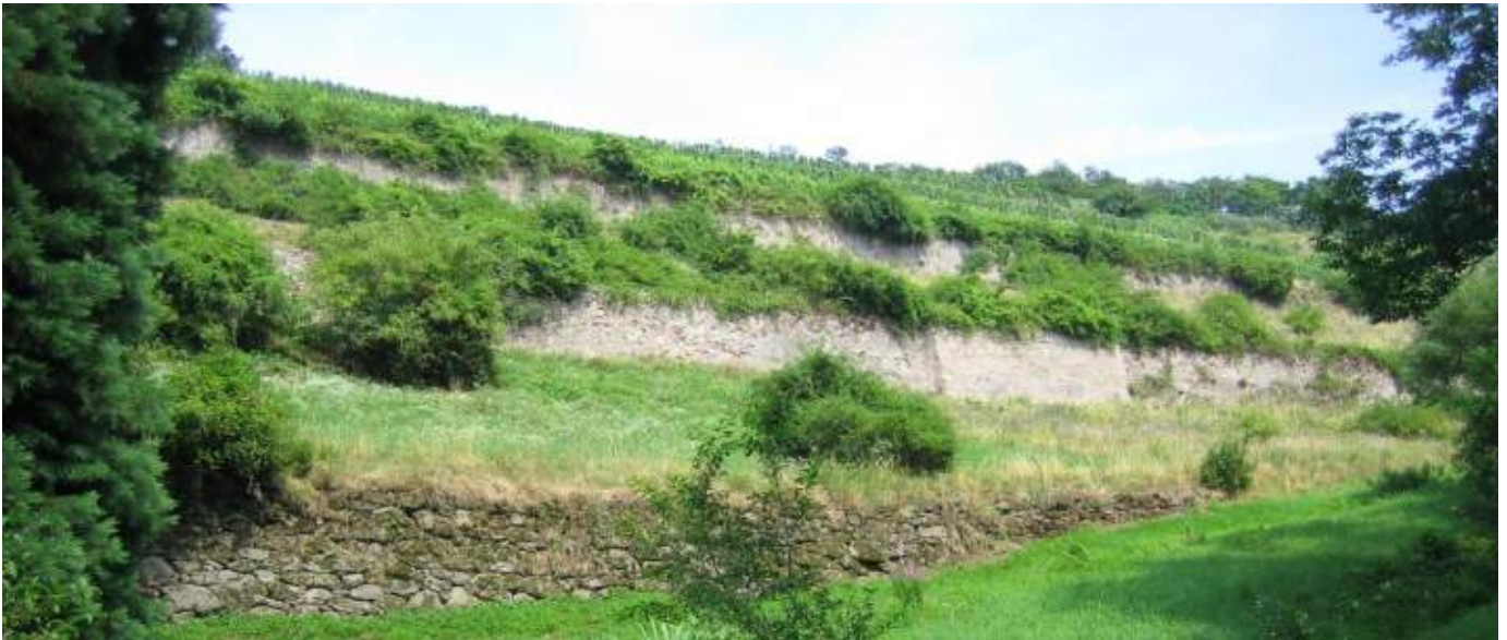
Abb. 7.5: Ein bei Mauereidechsen beliebter Platz: Weinbergmauern am Schriesheimer Madonnenberg.